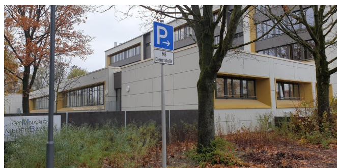
Die Dienststelle befindet sich am Hans-Leinberger-Gymnasium in Landshut.