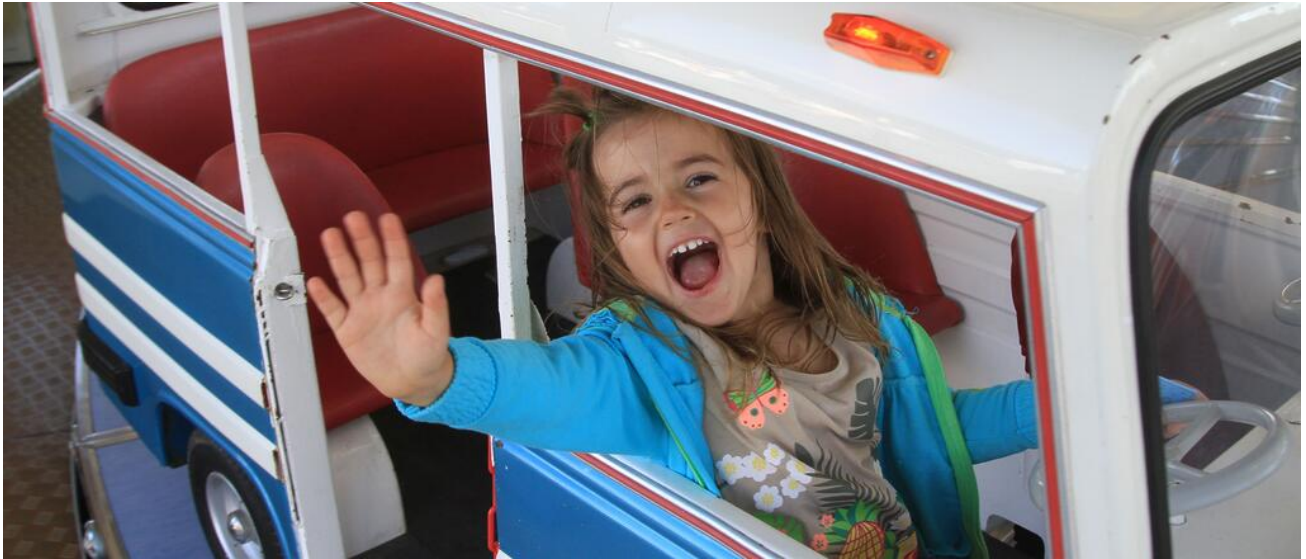
Schaustellerkinder sind Schülerinnen und Schüler auf Reisen

Seit dem Schuljahr 1996/97 ist im Freistaat Bayern die schulische Betreuung von Kindern aus Schaustellerfamilien, von Zirkusangehörigen und von fahrenden Personen neu geregelt und organisiert.