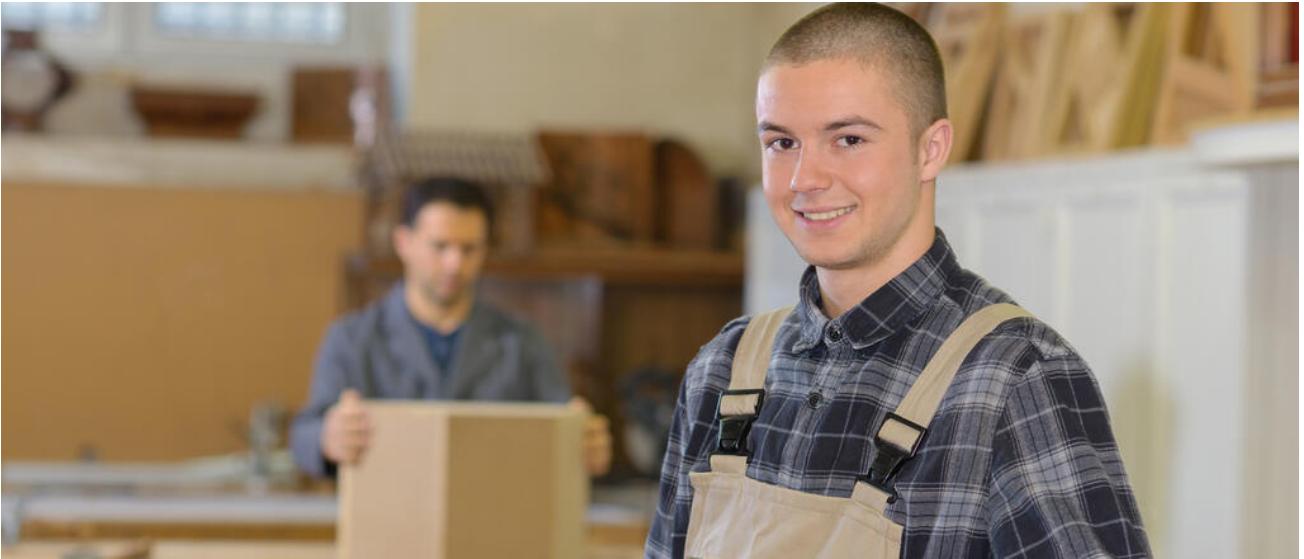
Lehrling in einer Schreinerwerkstatt

Die Mittelschule bietet den Schülerinnen und Schülern eine ausgeprägte Berufsorientierung. So werden bereits frühzeitig erste Erfahrungen im beruflichen Umfeld gesammelt und Anforderungen der Wirtschaft umfassend und altersgerecht kennengelernt.