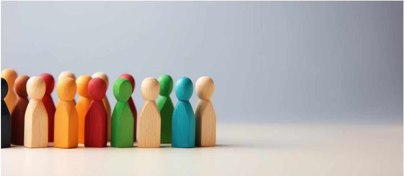
Vielfalt in den sonderpädagogischen Förderschwerpunkten

Zur Klärung und Beschreibung des sonderpädagogischen Förderbedarfs der Schülerinnen und Schüler werden spezifische sonderpädagogische Förderschwerpunkte diagnostiziert.