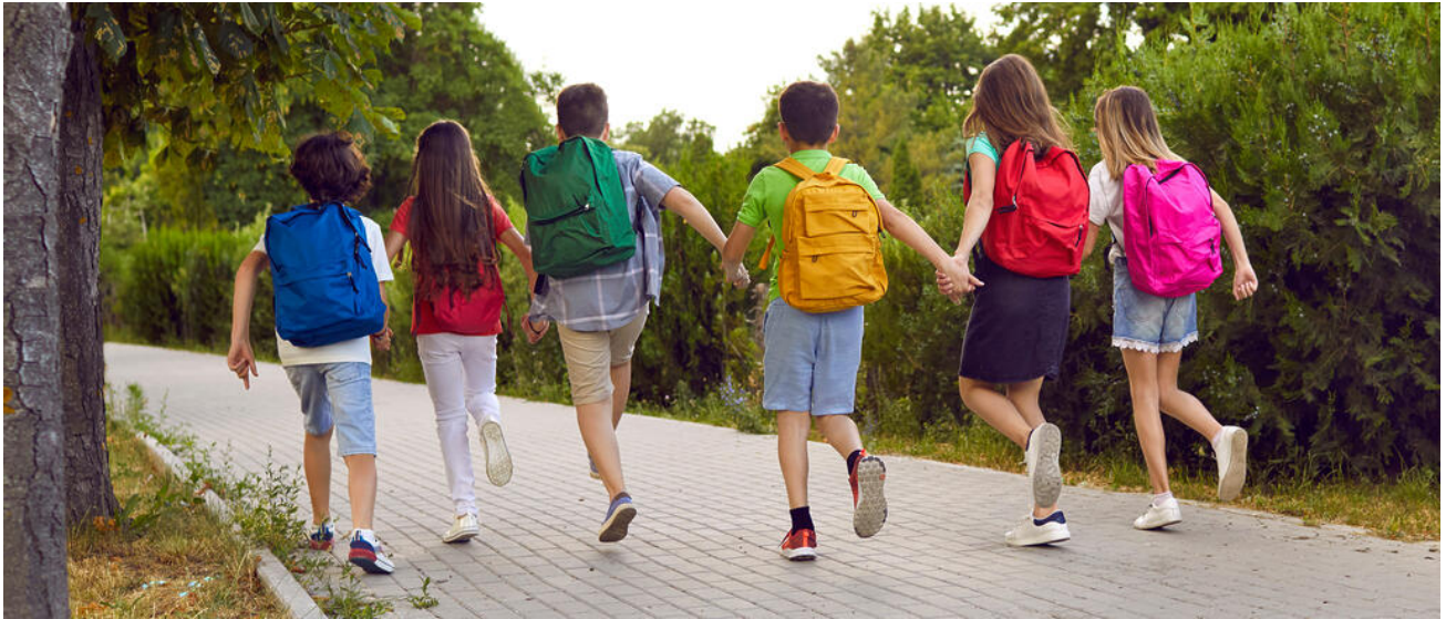
Kinder laufen Hand in Hand einen Weg entlang

Inklusion heißt, dass Menschen mit und ohne Behinderung an allen Lebensbereichen gleichberechtigt teilhaben. Dazu gehört auch das gemeinsame Lernen von Kindern und Jugendlichen mit und ohne sonderpädagogischen Förderbedarf. Der „Bayerische Weg der Inklusion“ eröffnet diesen Schülerinnen und Schülern passgenaue Bildungswege in unserem differenzierten und durchlässigen Schulwesen in Bayern.