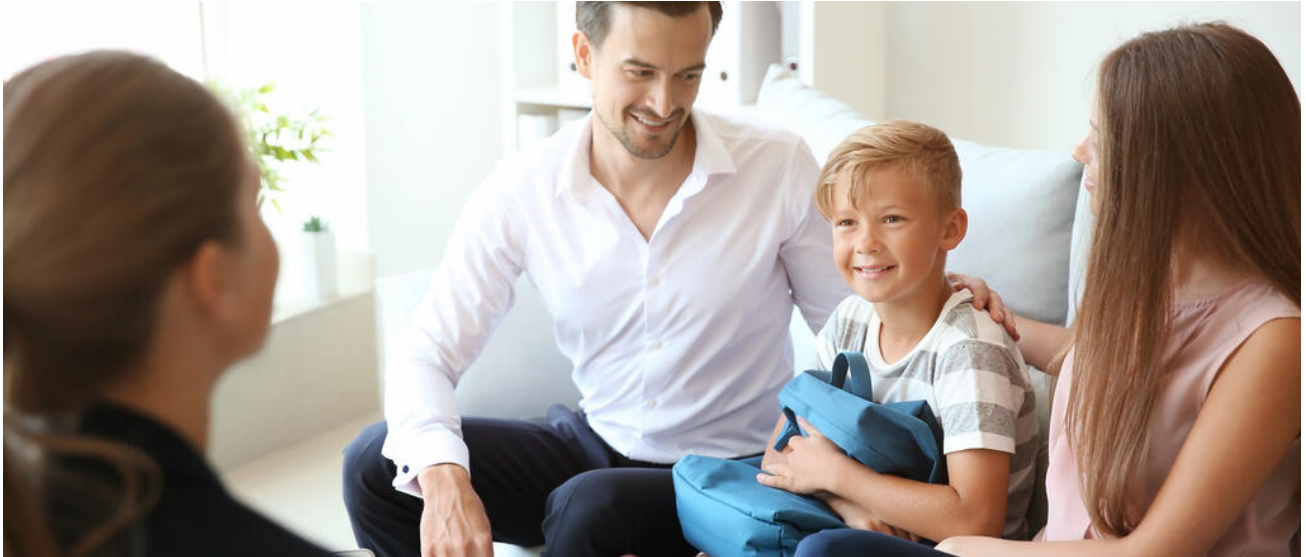
Ein junges Paar sucht mit Kind eine Beratung auf

Bayern bietet bei Fragen der Inklusion ein dichtes und stabiles Beratungs- und Unterstützungsnetzwerk für Schülerinnen und Schüler, Erziehungsberechtigte, Lehrkräfte und Schulen.