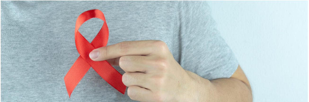
Schüler mit Aidsschleife

Die Bekämpfung des HI-Virus und die Eindämmung von AIDS sind nach wie vor drängende weltweite Probleme . Auch in Deutschland steigt die Rate der HIV-Erstinfektionen trotz eines hohen Wissensstandes in der Bevölkerung wieder an. Die AIDS-Prävention an den Schulen dient der gesundheitlichen Aufklärung und hilft, soziale Ausgrenzung von AIDS-Infizierten zu verhindern.