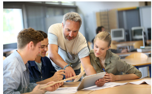
Die Begleitung und Beratung der Schülerinnen und Schüler gehört ebenso wie die Unterstützung zu den Kernaufgaben der Lehrkräfte am Gymnasium

https://www.km.bayern.de/lernen/schularten/weitere-schularten/internate mit angegliedertem Gymnasium dar.