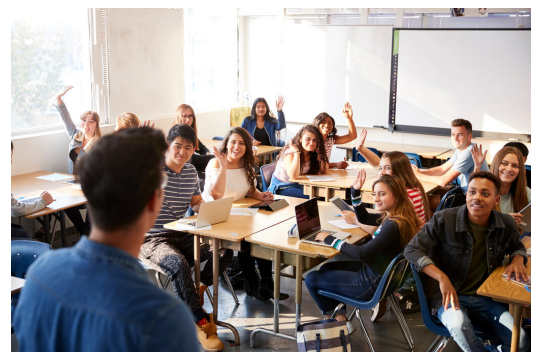
Das breite Fächerspektrum am Gymnasien kommt den individuellen Interessen und Neigungen der Schülerinnen und Schüler entgegen

Je nach Interesse und Begabung kann aus verschiedenen Fremdsprachen und Ausbildungsrichtungen gewählt werden. Individuelle Förderung ist integraler Bestandteil gymnasialer Pädagogik.