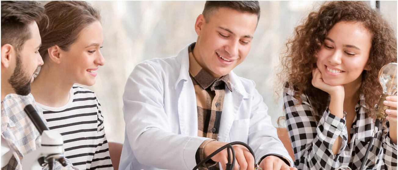
Das Naturwissenschaftlich-technologische Gymnasium setzt einen Schwerpunkt auf den MINT-Bereich