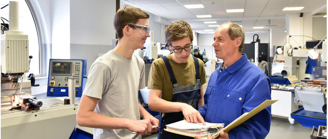
Berufliche Perspektiven für Schülerinnen und Schüler mit sonderpädagogischem Förderbedarf

Für Schülerinnen und Schüler mit sonderpädagogischem Förderbedarf ist es wichtig, am Ende der Schulzeit eine realistische berufliche Perspektive zu entwickeln. Durch fachkundige Beratung und eine individuelle professionelle Begleitung bei der Berufsorientierung lassen sich Barrieren überwinden und vielfältige Wege aufzeigen.