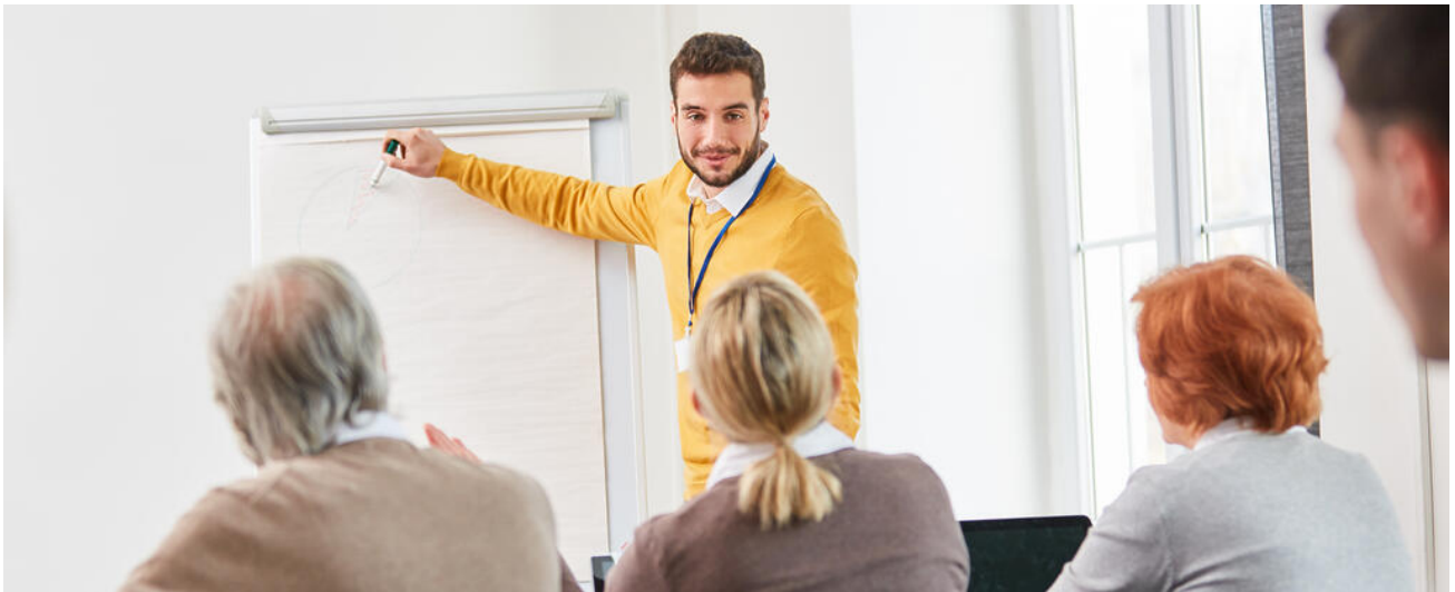
Fortbildungsangebote zum Einsatz mobiler Endgeräte

Neben der Verfügbarkeit einer performanten IT-Infrastruktur hängt der Erfolg des Einsatzes mobiler Endgeräte in Schülerhand maßgeblich von der Kompetenz der Lehrkräfte ab. Ein flächendeckendes Ausrollen eines 1:1-Ausstattungskonzepts soll daher von gezielten Fortbildungen flankiert werden. Ziel ist der Erwerb medienbezogener Lehrkompetenzen, um mobile Endgeräte im konkreten Unterrichtsfach erfolgreich einzusetzen.