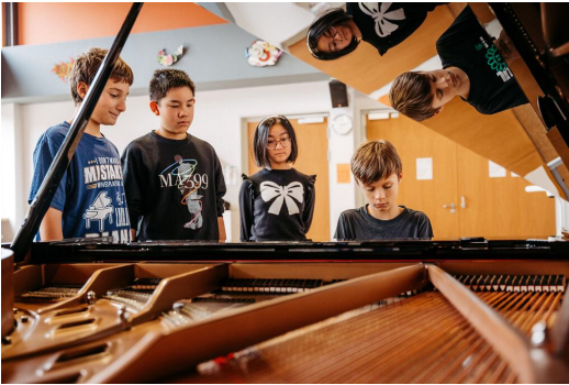
Teilnehmer bei der Musikwerkstatt 2024