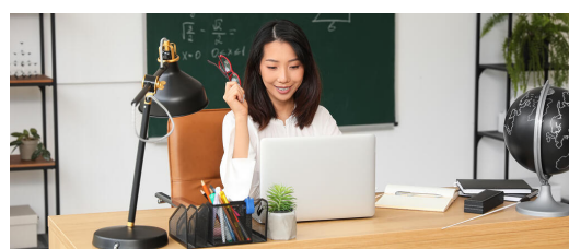
Die Ausstattung von Lehrkräften mit

Die Ausstattung der bayerischen Lehrerinnen und Lehrern mit schulischen digitalen Endgeräten leistet einen wichtigen Beitrag zur weiteren Professionalisierung des schulischen Arbeitens in Zeiten der Digitalisierung und schafft die Voraussetzung für eine rechtssichere Verarbeitung