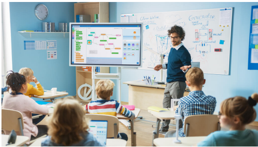
Digitale Klassenzimmer ermöglichen den gewinnbringenden und zeitgemäßen Einsatz elektronischer Medien und Werkzeuge im Unterricht

Bayern ist in der komfortablen Situation, im Gegensatz zu anderen Ländern bereits sehr früh in die Digitalisierung investiert zu haben. In den Förderprogrammen im Rahmen des → Masterplans BAYERN DIGITAL II