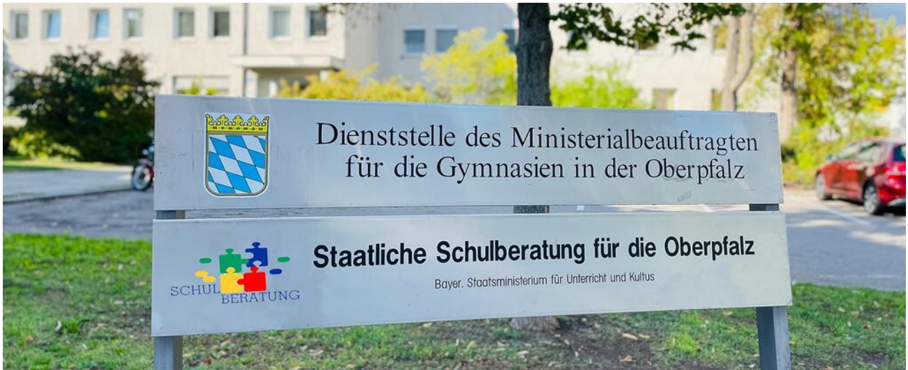
Staatliche Schulberatungsstelle für die Oberpfalz in Regensburg